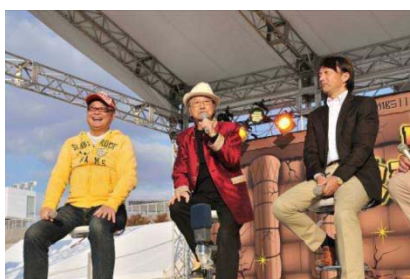
2012年秋まつり (長居公園・自由広場)