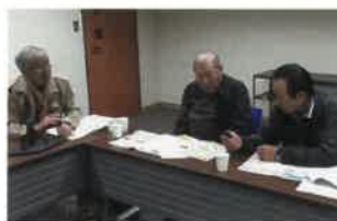
アイデア・発明委員会

現在の若者が楽しむゲームと言えば、スマホ・PC 相手に個人が遊ぶもの。昔はもっと人と人のコミュニケーションツールとしてゲームを楽しん